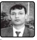
विजय रानामार्त तनहुँ

१ बहिनी बिसिएर मामा बिसिएर कतिसम्म गरौँ मैले धामा बिसिएर माफ गर तिमीलाई माया गर्न सकिदैन म जन्मदिने आभनै बाउआमा बिसिएर